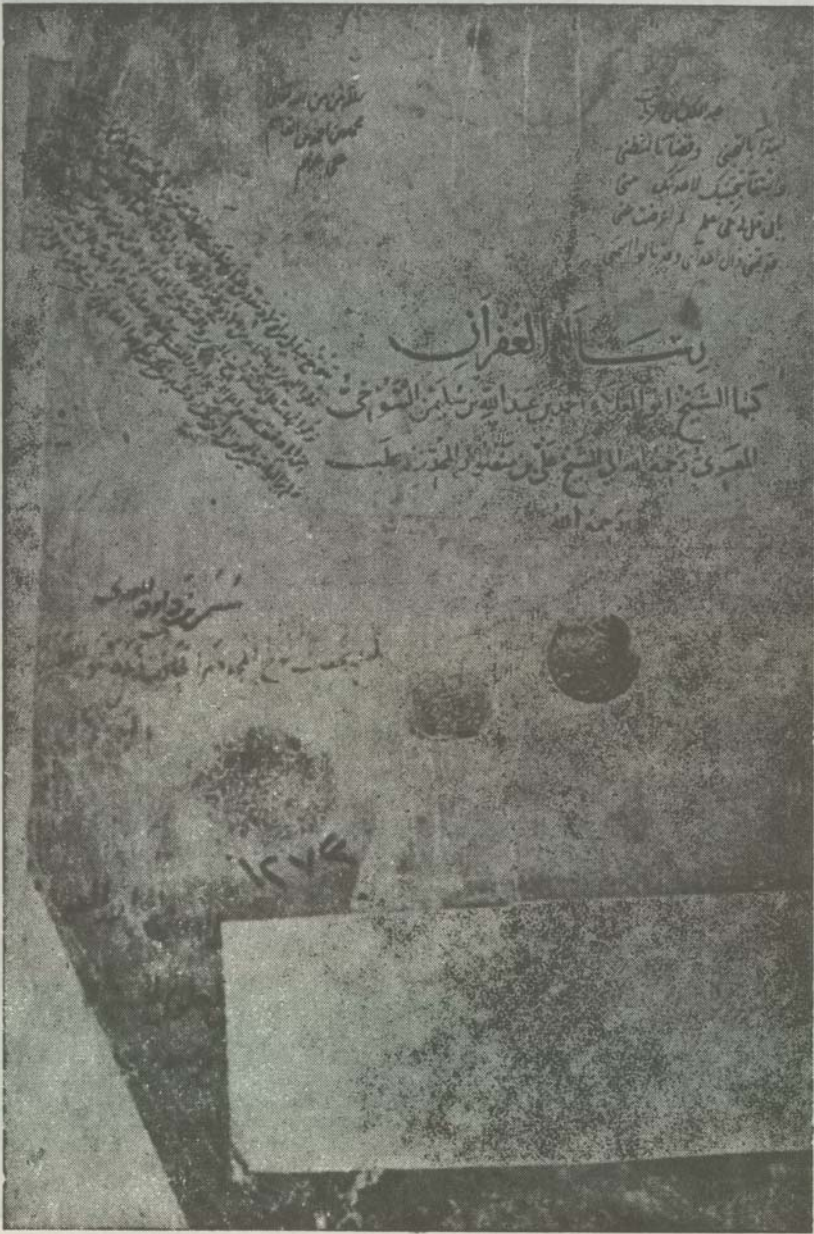
الصفحة التي تحمل عنوان الرسالة في نسخة مكتبة كوبريللي زاده باستنبول (ك) وعليها رقم النسخة في المكتبة ، وتوقعات ترى بنصها على غلاف نسخة (ش)