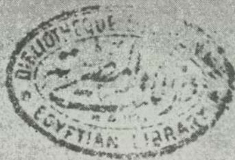
غلاف النسخة المنقولة عن نسخة الآستانة (ز) وعليه تاريخ النسخة المنقولة عنها ، وختم دار الكتب المصرية ورقم النسخة في الدار